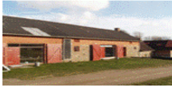
Mellem Hald og Kragelund

Hald Hovedgård Naturskolen v.Hald Ravnsbjergvej 710 8800 Viborg, tlf. 86 63 85 00 36 senge