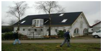
Mellem Nørhoved og Nør- relide

Nørhoved Hærvejens Bondegårdsferie Nørhovedvej 16, 8766 Nr. Snede Tlf. 75 77 10 25 og 20 48 80 25 40 senge – salg af madvarer