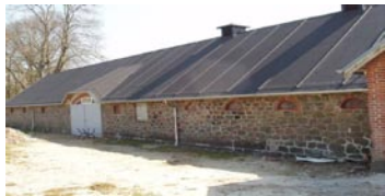
Mellem Kragelund og Nørhoved

Kragelund gl. præstegård, Sinding Hede- vej 2, Kragelund, 8600 Silke- borg, tlf. 86 86 72 11 36 senge (købmand i byen)